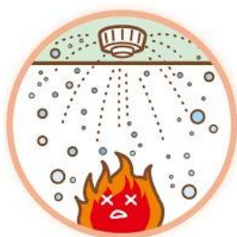
スプリンクラー設備