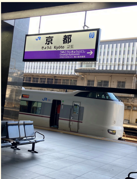
写真：駅ホームイメージ（提供）

「怖かったね。今から病院に行くから、もう大丈夫だよ」 その一言で心が救われました。