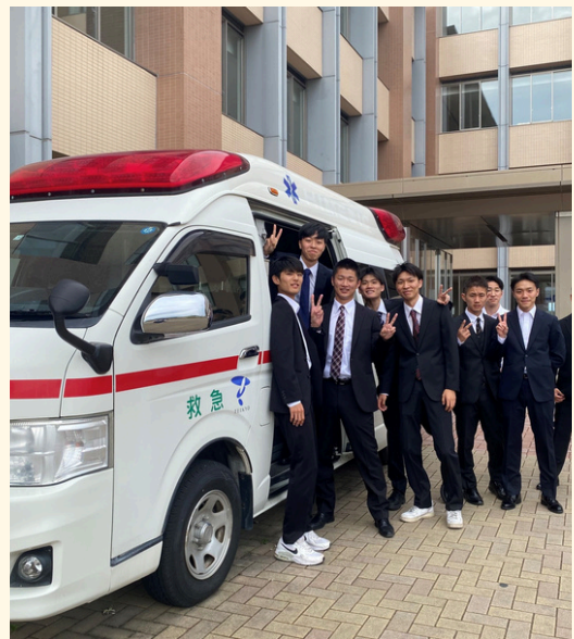
写真：一緒に救命士を目指した仲間たちと