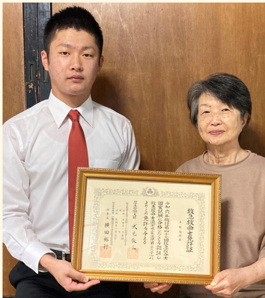
写真：きっかけとなったお祖母さまと撮影